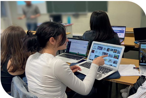
Les étudiants en communication de l'IUT de Tours VAINQUEURS du challenge 2022 pour la marque Club Maté.